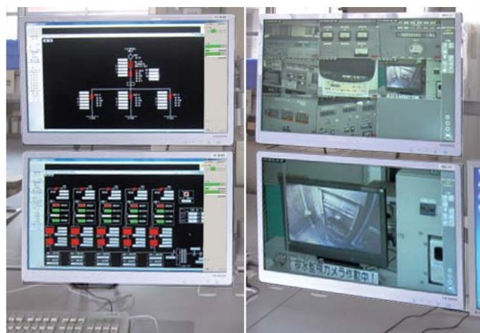
中央監視システム